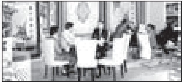
گزارشی از برگزاری دومین جشنواره بین المللی فرش کاشان (نمایشگاه فرش دستباف و ماشینی)